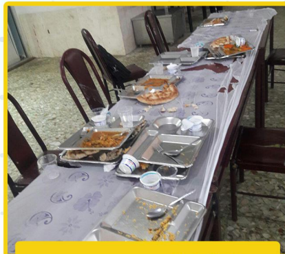
دانشگاه از دریچه دوربین