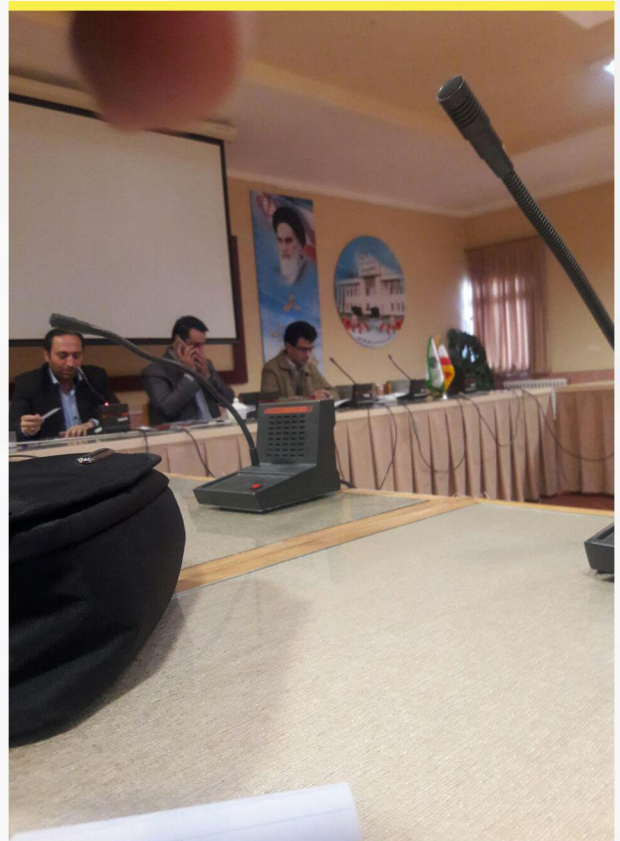
اندر حواشی نقد نشریات دانشگاه گلستان ۱۳ اسفند ۱۳۹۶