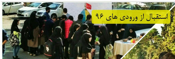
استقبال از ورودی های ۹۶