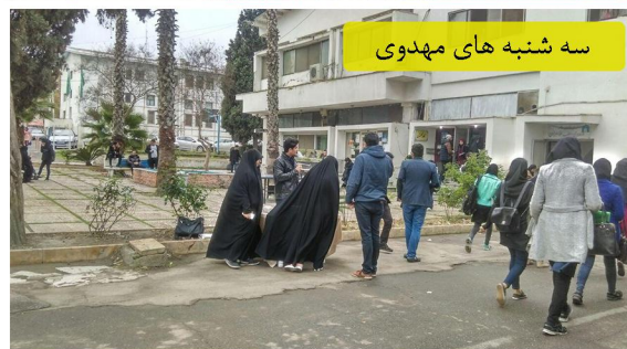
سه شنبه های مهدوی