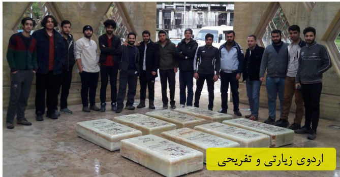
اردوی زیارتی و تفریحی

گزارش عملکرد کانون مهدویت (مهر تا اسفند ۱۳۹۶)