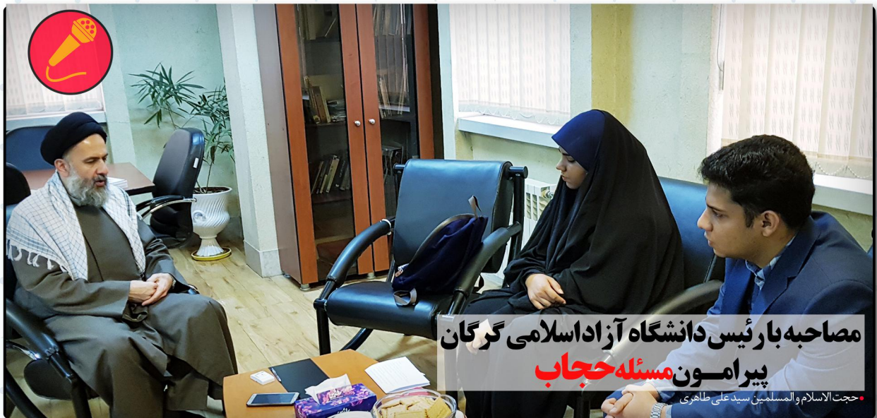
مصاحبه با رئیس دانشگاه آزاد اسلامی گرگان پیرامون مسئله حجاب