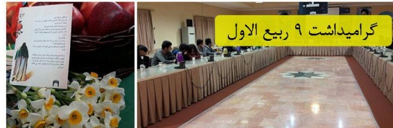
گرامیداشت ۹ ربیع الاول