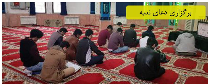
برگزاری دعای ندبه