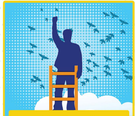
منجلابی به نام زندگی