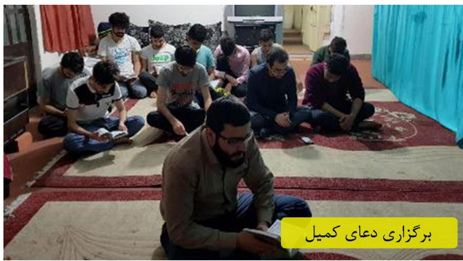
برگزاری دعای کمیل